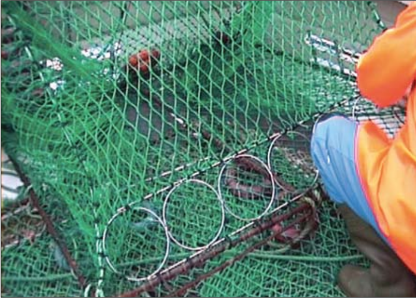
Figur 4.6.3 Kongekrabbeteine med seleksjonsringer for å slippe ut liten kongekrabbe. King crab pot with selection rings to release undersized king crab.