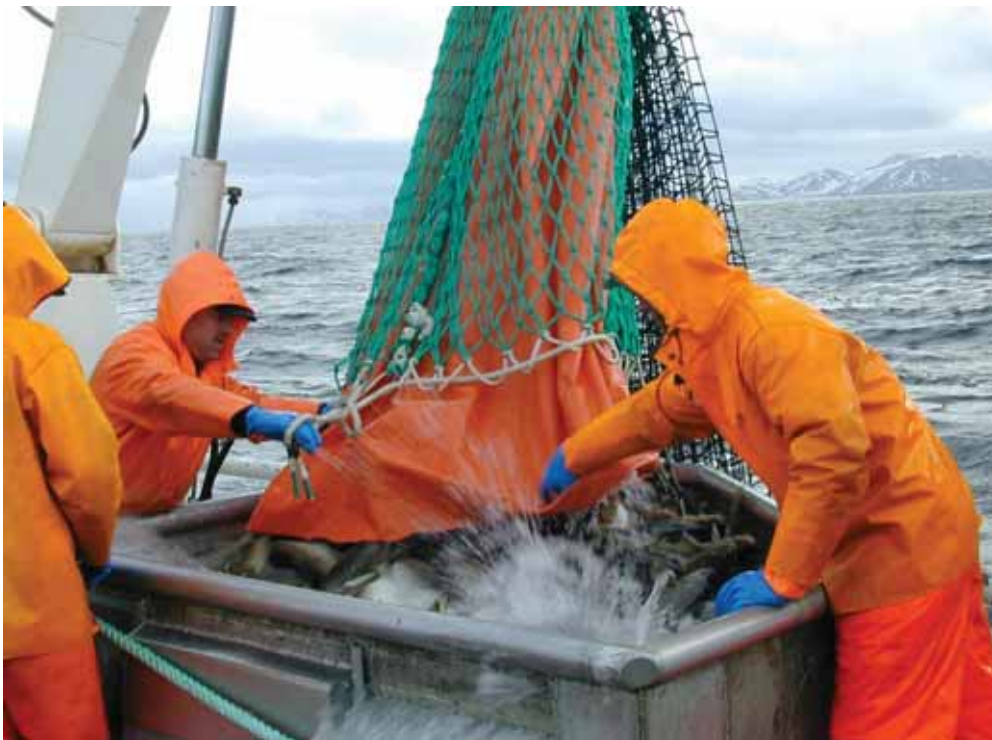
Bilde 2. Tømming av fisk fra snurrevadbåt med innmontert lerretsløft. Fisk løftes om bord i vannbad, og utsettes for lite eller moderat press.

Fra de største fartøyene kom det forslag til at omkretsen ble gitt i form av meter. Med kvadratmaske og stolper som går i sirkel rundt sekken skulle det ikke være vanskelig å gi eksakte mål på omkrets. Problemet som oppstår nå når flere av de større snurrevadfartøyene begynner å bruke 180 m/m masker, er at vidden på sekken blir alt for stor i forhold til vidden på løftet. Dette medfører vanskeligheter med å få fisken ned i løftet. Forskjellen på en kvadratmaskepose med 125 m/m kontra 180 m/m maskevidde blir ganske stor. 100 maskers omkrets med stolpelengde på 90 m/m gir en omkrets på ca 9 meter og med en diameter på rundt tre meter. Samme type sekk, men med 62,5 m/m stolpelengde gir en sekk med en omkrets på 6,25 meter og diameter på ca to meter. I volum vil den store sekken vær mer enn dobbel så stor som den minste. Det er dessuten tatt til orde for at den bakerste meter i kvadratmaskepose blir formet som et kremmerhus inn mot løftesekken.